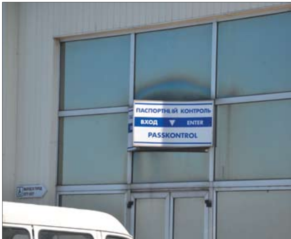
Основными методами принуждения к выплате алиментов являются ряд ограничений, в том числе запрет на выезд за границу

Однако все существенно изменилось в связи с принятием Закона № 2475-VIII, предусматривающего ряд жестких мер, в числе которых временные ограничения в правах, штрафы, ужесточенная административная ответственность за неуплату алиментов.